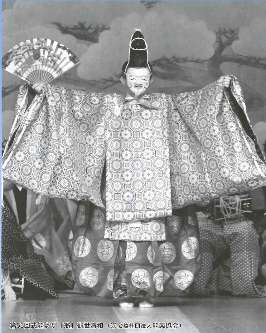
第55回式能より「翁」観世清和