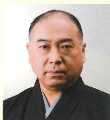
觀世 鏡之丞 [能楽師・能楽協会 理事長]

1986年生。2008年宗家継承。伝統的な演出に重きを置く他、異流共演多数出演や復曲、公演演出なども行う。2016年東アジア文化交流使に任命され、香港・イタリアをはじめとした、海外文化活動にも力を入れている。重要無形文化財総合指定保持者。