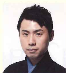
宝生 和英 [能楽師・宝生流二十世宗家]

1959年生。1990年宗家継承。国内公演はもとより海外公演、及び「箱崎」「阿古屋松」などの復曲、「利休」「聖パウロの回心」など新作能にも意欲的に取り組む。重要無形文化財総合指定保持者。2012年度芸術選奨文部科学大臣賞受賞。1999年フランス芸術文化勲章シュバリエ、2015年紫綬褒章など受章。