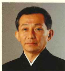
觀世 清和 [能楽師・觀世流二十六世宗家]

1959年生。1990年宗家継承。国内公演はもとより海外公演、及び「箱崎」「阿古屋松」などの復曲、「利休」「聖パウロの回心」など新作能にも意欲的に取り組む。重要無形文化財総合指定保持者。2012年度芸術選奨文部科学大臣賞受賞。1999年フランス芸術文化勲章シュバリエ、2015年紫綬褒章など受章。