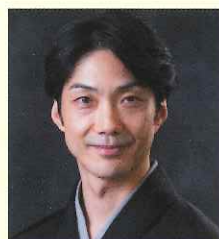
野村 萬斎 [能楽師]

1956年生。国内外の数多くの舞台に参加し、現代音楽の武満徹の能舞「水の曲」に出演するなど、古典を越えた世界でも幅広く活躍。重要無形文化財総合指定保持者。2008年度日本芸術院賞受賞。2011年紫綬褒章受章。