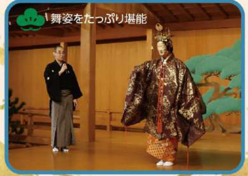
舞姿をたっぷり堪能