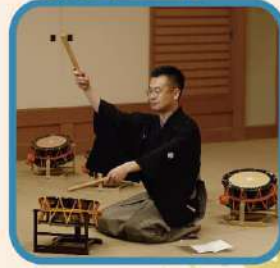
能の音楽も 丁寧に解説