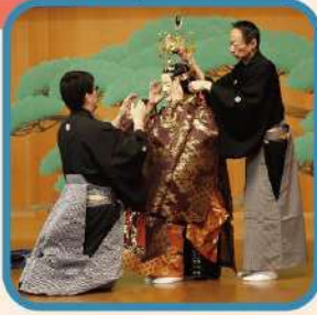
能面・能装束や 能の型(演技)も紹介