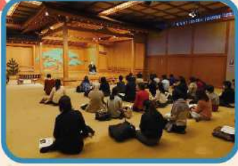
主に地域の能楽堂を活用 特別な空間で能楽体験