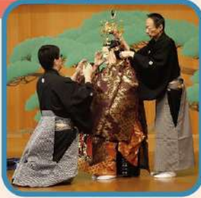
能面・能装束や 能の型(演技)も紹介