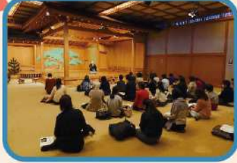
主に地域の能楽堂を活用 特別な空間で能楽体験