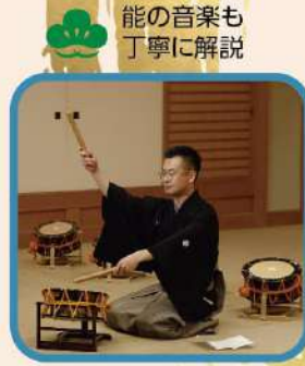
能の音楽も 丁寧に解説