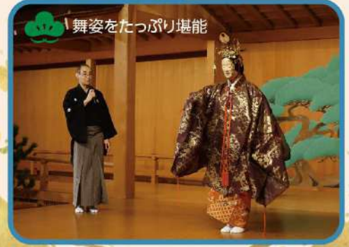
舞姿をたっぷり堪能