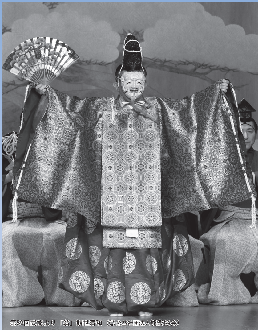
第59回式能より「翁」観世清和