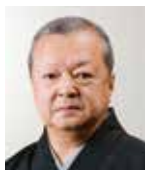
大坪喜美雄 (人間国宝)