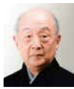
山本東次郎 (人間国宝)