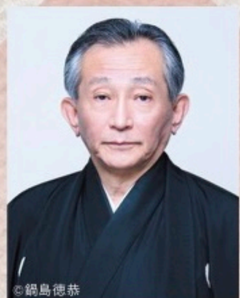
二十六世観世宗家 観世 清和