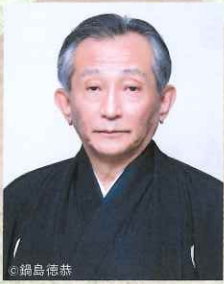
二十六世観世宗家 観世 清和