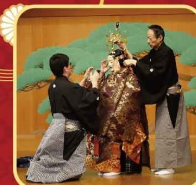
能面・能装束や 能の型(演技)も紹介