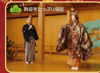
舞姿をたっぷり堪能