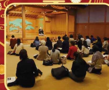
地域の能楽堂を活用 特別な空間で能楽体験

※上記、個人情報等は弊協会プライバシーポリシーに則り厳正に管理し、本事業のご連絡、実施報告、ご同意事項以外には使用致しません。 ※定員になり次第締切とさせていただきます。 ※申込内容に不備がある場合は、応募が無効になることがありますので、ご了承下さい。